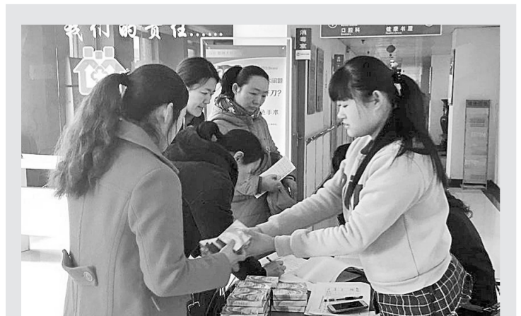
近日,林山寨街道郑州日报社区通过张贴宣传页、康检通知进楼栋、电话提醒等方式进行计划生育相关法律法规、健康知识宣传。