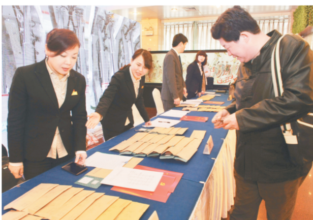
分钟内就可办完。务实、高效、精简的会风从报到环节就体现出来。在委员们领取的资料中,一张印有会议纪律要求的红色纸张十分醒目。

记者注意到,黄河饭店、天河大酒店、河南饭店等委员驻地没有摆放鲜花,也没有悬挂彩旗。报到流程简单明了,现场使用了电子识别设备,政协委员只需将出席证在感应器上轻轻一刷,个人资料就显示在屏幕上。从签到、领材料到登记房间,一