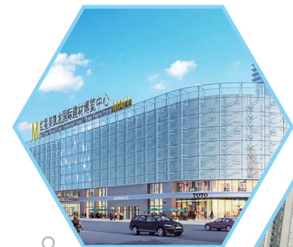
红星美凯龙效果图

二七区人和路街道办事处作为二七新区组团的起步区，成立两年来显示出蓬勃发展的新锐之势。今年以来，该街道以“品质二七、温暖二七、田园二七”建设为指引，精准化发力，项目化推进，扎实推进“八大行动”，实施全面从严治党“八项工程”，突出党建引领，项目建设、产业提升、基础建设、生态优化、民生服务、安全稳定7项重点工作，努力构建“品质人和、温暖人和、文明人和、平安人和”四位一体发展新格局。