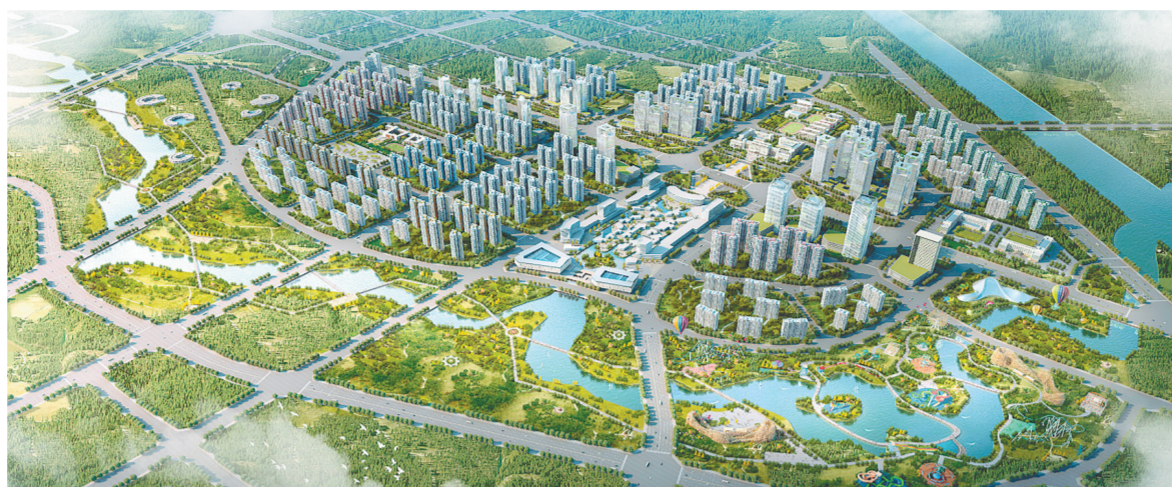
市民公共文化服务区规划效果图

目标已经确定，蓝图已经绘就。中原区全区上下撸起袖子、甩开膀子大干快上，率先发展，尽早建成郑州市中心城区西部核心区，积极回应人民群众新期待，为郑州建设国家中心城市作出更大贡献，以优异成绩迎接党的十九大胜利召开。