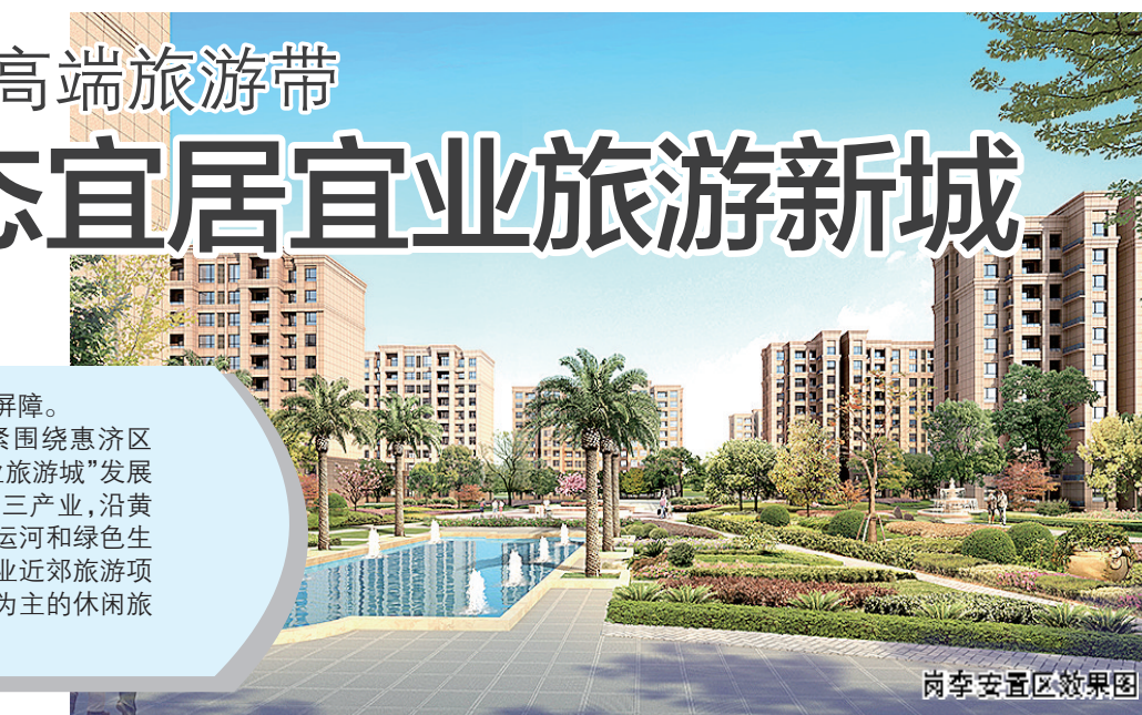
岗李安置区效果图

护林带,为全市人民构筑起一道绿色屏障。近年来,大河路街道办事处紧紧围绕惠济区“产业融合创新发展区,生态宜居宜业旅游新城”发展战略,大力发展与旅游业相关联的第三产业,沿黄各村围绕黄河母亲河、隋唐大运河和绿色生态农业做文章,搞好生态林建设和农业近郊旅游项目开发,发展以养殖、垂钓、农业观光为主的休闲旅游观光园区。