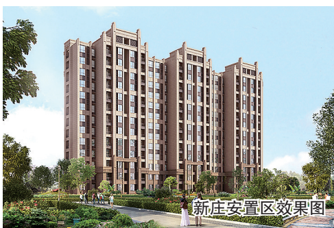
新庄安置区效果图

以“两学一做”学教和“两抓一保”活动为契机,狠抓党员作风转变,提升机关干部大局意识、责任意识、担当意识;以党建工作大格局引领街道工作开展,形成齐抓共管的基层党建良好氛围;围绕群众最关心、最迫切需要解决的问题实行党员承诺制度;抓好党建工作示范点建设,将党建与服务中心工作更好结合,发挥好党员先锋模范作用。