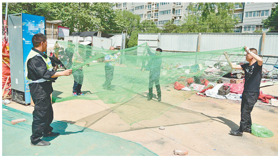
给裸露黄土覆盖防尘网

本报讯 二七区民安路一垃圾周转站存在不规范行为,记者采访时,淮河路街道办事处当即安排人员进行了整改。