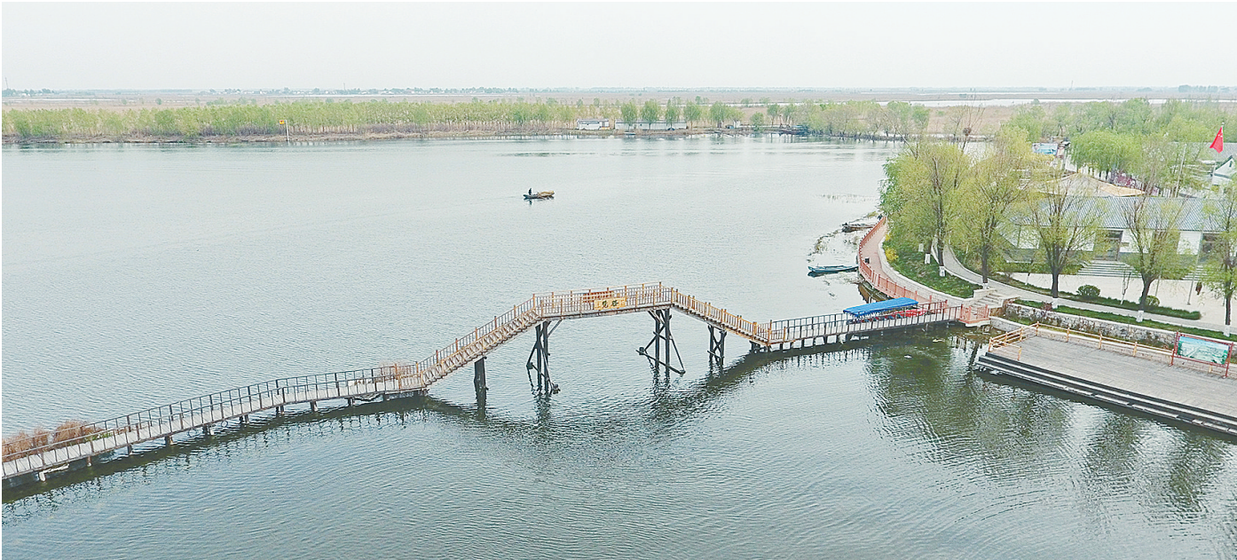
这是4月9日拍摄的雄安新区白洋淀水面。