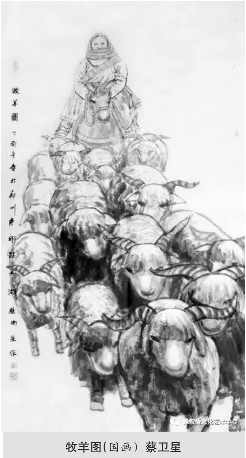
牧羊图(国画) 蔡文星