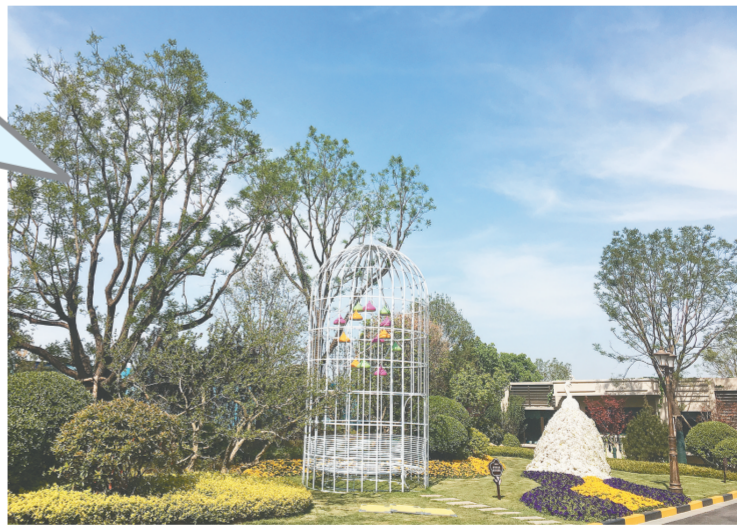
西安恒大御龙湾园林景观实景图

4月29日~5月1日,恒大中原公司开启了一场“豫见美好陕耀前行——2017恒大中原公司品鉴之旅”。在恒大中原公司的组织和邀请下,河南多家媒体及七十余位业主共赴西安,西安十余名媒体人士及三十余位业主则来到河南,双线出发,在感受豫、陕两地厚重历史底蕴和文化气息的同时,领略恒大中原公司的匠心精神与品牌魅力。 据悉,恒大地产集团中原有限公司是恒大地产集团在中原的重要战略布局。2017年1月1日,恒大集团打破省界壁垒,将河南公司与陕西公司合二为一,恒大地产集团中原有限公司正式成立。至此,公司在郑州、洛阳、南阳、西安、汉中地市中开发建设50多个精品项目,涵盖恒大金碧天下、恒大名都、恒大悦龙台、恒大绿洲、恒大华府、恒大城等多个产品系列,拥有老业主近20万人。 2016年,恒大中原公司销售额为290亿元,同比增长约123%。从河南到陕西,恒大中原公司屡创下销售奇迹。 在此次“豫见美好陕耀前行——2017恒大中原公司品鉴之旅”中,记者来到西安恒大御龙湾和西安恒大城市广场,发现恒大中原公司的魅力与实力。