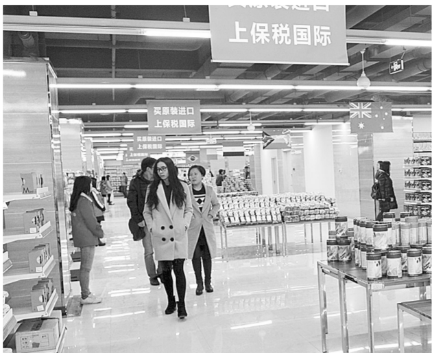
郑州已成跨境电商创新发展新高地。