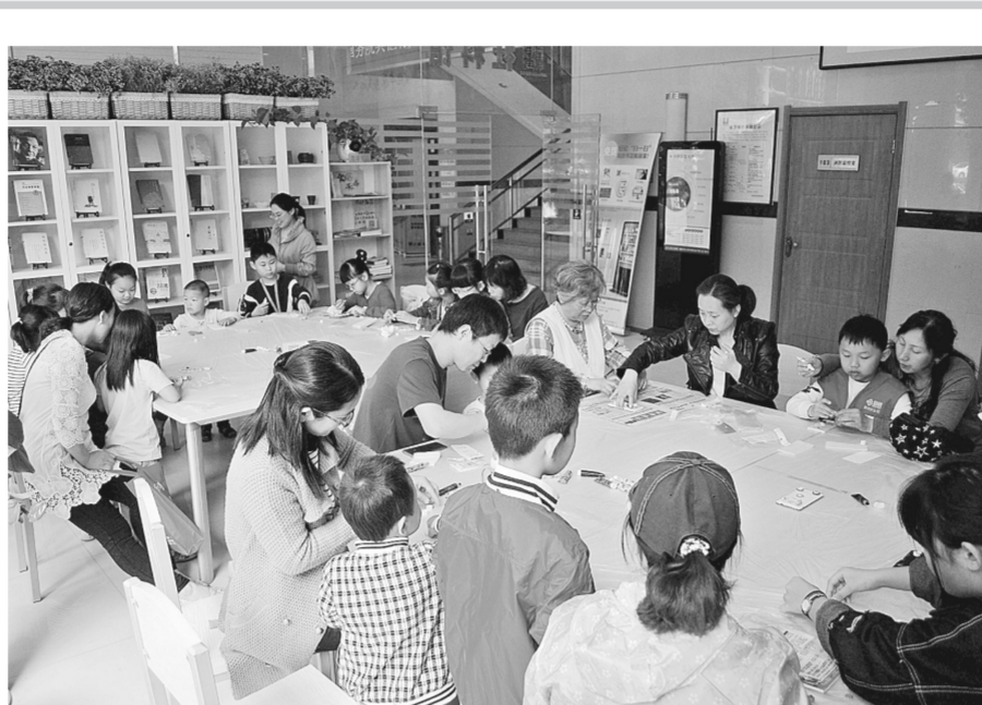
为丰富读者的业余生活,日前,中原区图书馆举办“手工DIY”——手机壳制作活动,让读者体验手工制作的乐趣。

今年省市将联动开展高新技术企业、科技型中小企业等涉企科技政策培训,实现全省各市县(区)培训全覆盖。结合科技创新政策进企业活动,开展“千企万人”科技政策服务进基层行动,从全省遴选1000名政策辅导员,为10000家企业做好科技政策、财税政策等服务工作。