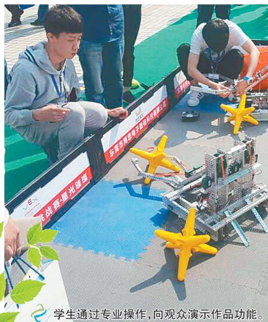
学生通过专业操作,向观众演示作品功能。