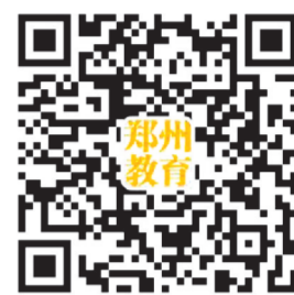
郑州教育专刊官方微信