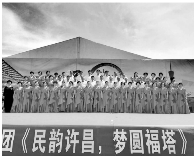
近日,许昌市老干部大学艺术团的老干部们来到中原福塔广场,为省会市民奉上了一场精彩的专场文艺演出。许昌市老干部大学艺术团成立于2001年,参加全国、省、市文艺演出比赛,荣获各类奖项80多项。每年,他们还会走进社区、老年公寓、游园广场等场所演出60余次。本报记者

本次巡回赛将邀请全国各省市越野e族、汽车俱乐部、户外运动者、摄影爱好者等,预计越野赛车600辆,参加人员1000人。比赛车辆预计200辆,本次比赛专业组共设10个名次奖项,公开组共设10个名次奖项,量产组共设10个名次奖项,女子组共设6个名次奖项,其他奖项设“最佳飞车奖”1名、“优秀车手奖”5名、“巾帼英雄奖”1名。