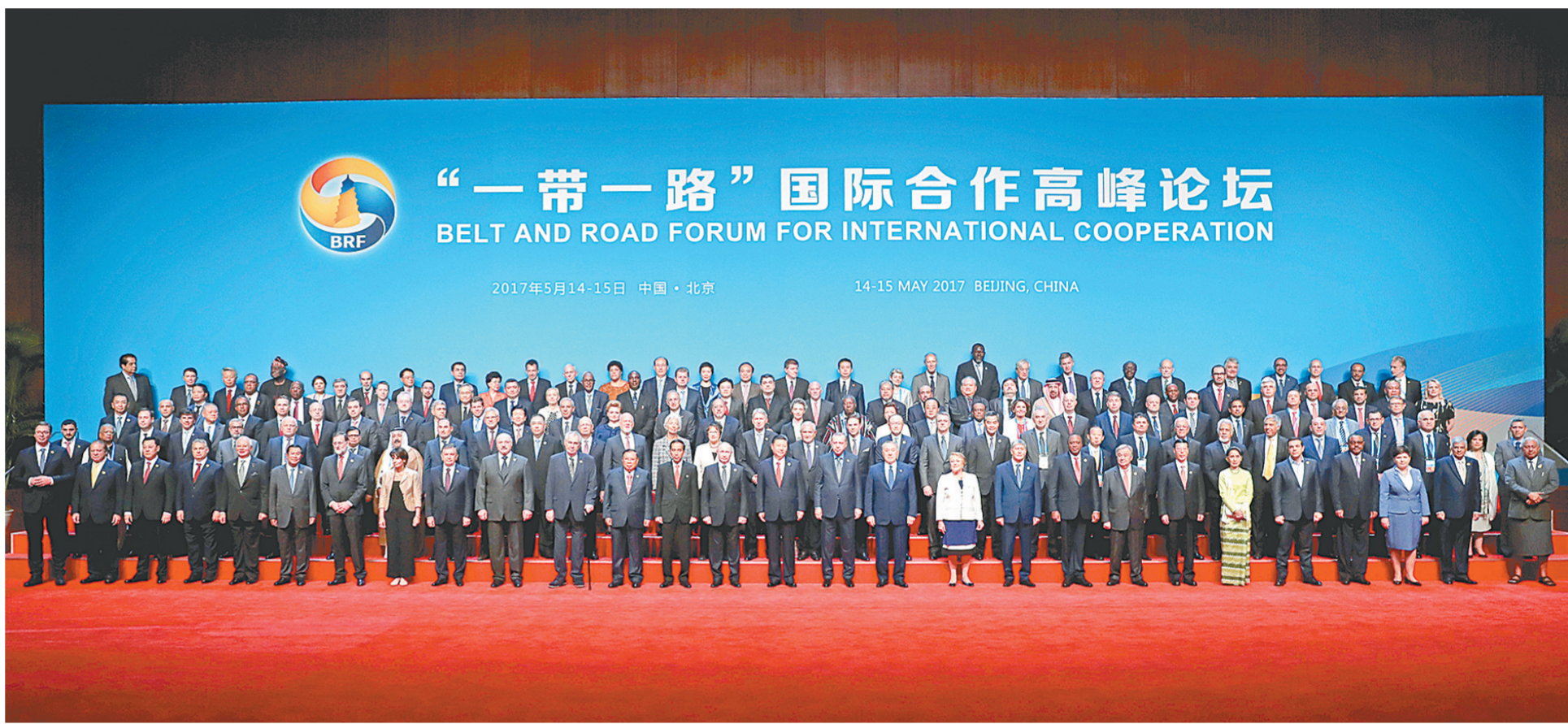
5月14日,国家主席习近平在北京出席“一带一路”国际合作高峰论坛开幕式,并发表主旨演讲。