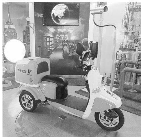
汉威电子新型产品