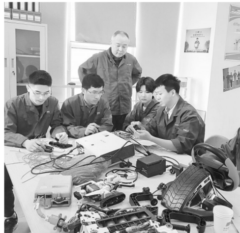
技术人员在科隆创客中心交流探讨