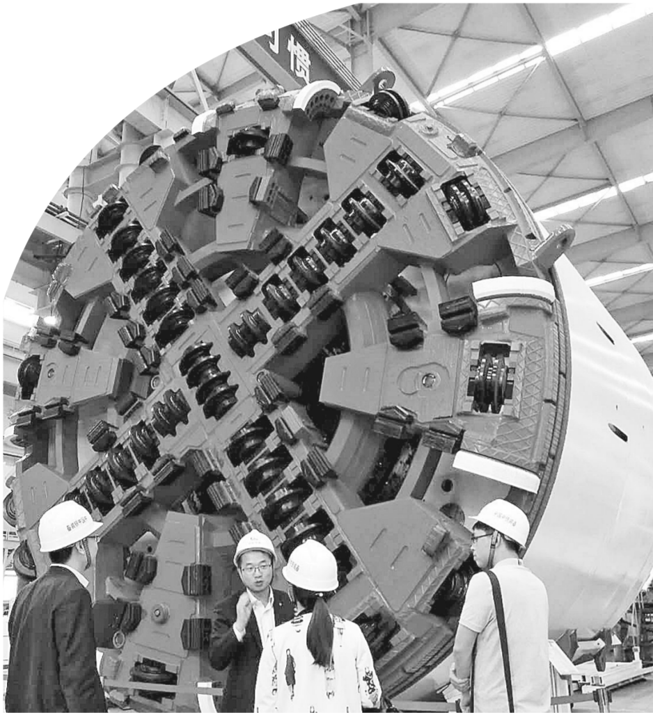
中铁盾构市场占有率稳居全国第一

汉威电子是郑州高新区众多科技“小巨人”企业坚持自主创新之路，成为国内细分领域领军企业的优秀代表之一。高新区作为郑州自创区的核心区，近年来，加大政策扶持，投入大量的人力、财力，自主创新能力显著，部分关键指标进入全国高新区第一方阵，知识创造和技术创新能力排名上升至第7位，综合排名上升至第12位，可持续发展能力排名上升至第7位，在2016年科技部发布的高新区孵化培育能力评估中，郑州高新区位列全国第二。并确立了战略性新兴产业——北斗导航与遥感、支柱型产业——信息技术应用与智能装备制造、驱动型产业——科技服务业的“121”主导产业的发展格局。