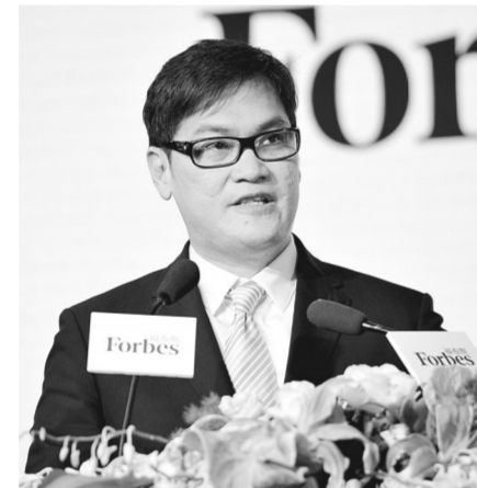
吴文贵说,“一带一路”、郑州和福布斯中国三者间,有一个共通点就是创新精神,这种精神在新经济形态下如同血液般至关重要,福布斯愿意为众多的潜力企业搭建一个了解郑州、东区的平台,通过进一步的交流与合作,为郑州建设国家中心城市献策出力。

“来到郑州,走进东区,处处都能感受到这座城市的发展速度和市民的热情。”2009年福布斯中国总裁吴文贵第一次来到郑州,时隔8年,当他再次来到郑州,焕然一新的国际机场和高铁站让他深感震撼。吴文贵表示,目前,新兴经济正重塑全新的商业世界,中国中小企业在技术与商业模式创新方面快速发展,正成为发展中的重要力量。而“福布斯中国潜力企业榜”已有12年评选历史,成为中国成长型企业最具权威性榜单。他表示,此次福布斯中国潜力企业创新峰会之所以选址郑州,正是基于对郑州城市发展的观察与思考。近年来,郑州发展迅猛,净流入人口增多,城市吸引力增强,航空港综合实验区、河南自贸区、国家中心城市等多重国家战略叠加,使之成为中国新兴城市崛起中的重要代表。“郑州是‘一带一路’重要节点城市,郑东新区又是国务院确定的中原经济区金融集聚核心区,可以说,郑东新区是中原经济区的龙头核心,承载着整个中