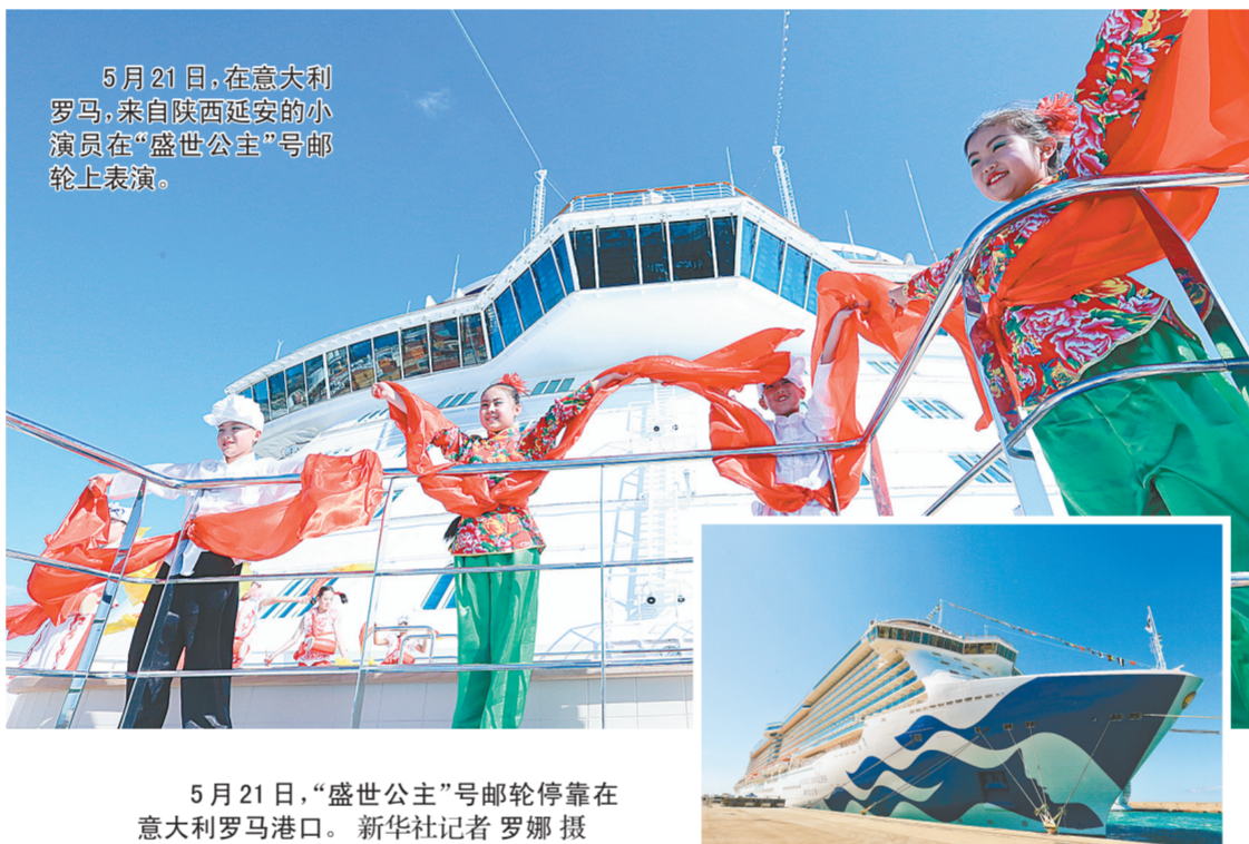
5月21日,“盛世公主”号邮轮停靠在意大利罗马港口。

们表演了原汁原味的陕北秧歌和腰鼓,博得满堂喝彩。“盛世公主”号上的精彩表演还不止于此。伴随航行,一系列含有中国元素的文化交流活动将按照“丝路·缘”“丝路·乐”“丝路·舞”“丝路·秀”“丝路·味”“丝路·画”和“丝路·歌”7个主题陆续呈现。李小林在启动仪式上说,海上丝绸之路是东西方文化交流之路,源于不同文明之间的相互吸引,希望通过本次活动让更多国际朋友认识、了解、感受、喜爱丰富多彩、开放包容的中国文化和丝路精神。中国驻意大利大使官使衔参赞郑璇表示,此次活动为增进“一带一路”相关国家人民互信、发展中意民间友谊、促进“一带一路”民心相通注入了新活力,可谓恰逢其时。