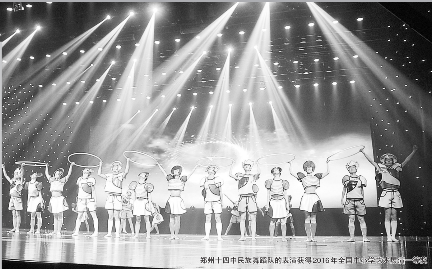
郑州十四中民族舞蹈队的表演获得2016年全国中小学艺术展演一等奖

对于致力于“做有未来的教育”的郑州教育人来说,教育是发现,是分享,是成长。课程、教学、评价是学校育人的核心要素,也是学校内涵发展、品质提升、本质彰显的关键环节。评价体现育人导向,落实育人功能,在推进道德课堂建设过程中,郑州教育站在立德树人的高度,不断对教育质量综合评价改革进行规划、设计和实践。基于道德课堂的教育理论和实践,郑州最新发布的中招理念开始积极践行“评价即育人”的教育观念,从“补短教育”走向“扬长发展”,让学生绿色向阳生长。