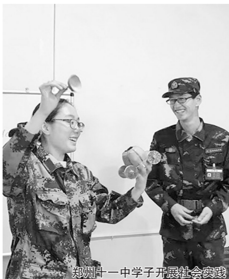
郑州十一中学子开展社会实践

学校教育以育人为本,发挥评价的育人功能,促进学生主动发展,已成为郑州教育新课程改革的重要理念之一。在道德课堂理念下,郑州教育主张教育评价应该遵循评价标准与培养目标一致的评价原则,用多元、综合的评价促进学生德智体美劳的全面发展。这种遵循教育规律、服从教育目的的评价,才是“有道德的评价”,才能促进学生正确的世界观、人生观和价值观的形成,才能给社会以正确的教育价值导向,真正发挥评价的育人功能。