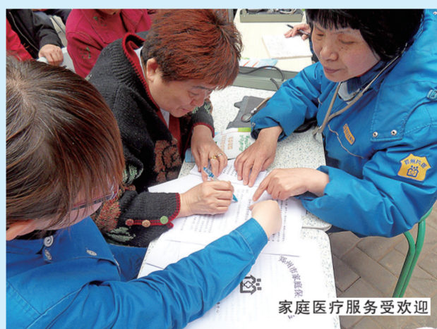
家庭医生服务受欢迎