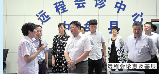
远程会诊惠及基层

5月15日,是第24个国际家庭日,今年的主题是“健康家庭,健康中国”。当天,由市卫生计生委承办的国际家庭日主题活动在绿城广场举行。“幸福家庭”推选活动是我市人口计生工作出色成绩之一,多年来,通过各级卫生计生部门的协同努力,全市人口计生工作取得了显著成效。