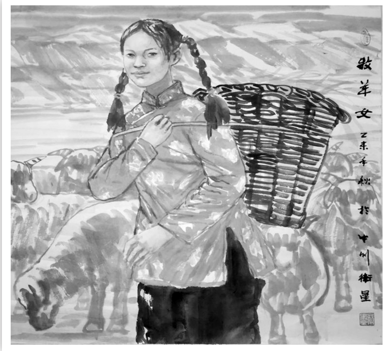
牧羊女(国画) 蔡卫星

《走出巴颜喀拉》长卷的创作母题是黄河。作为中华文明发源地和哺育地之一，黄河历来被看作是中华民族的象征。李伯安的创作思路是：文明的源头——黄河，黄河的源头——巴颜喀拉山。身处中华民族文明发祥地黄河流域和中原地区的李伯安，在1988年首次深入青海藏区写生体验后，就将自己的艺术创作目光锁定在了巴颜喀拉。他为中华民族的风骨、中华文明博大精深的精神表现，找到了一个极具挑战性的表现方式和与众不同的绘画角度，为自己的艺术生涯设定了一个宏大目标。