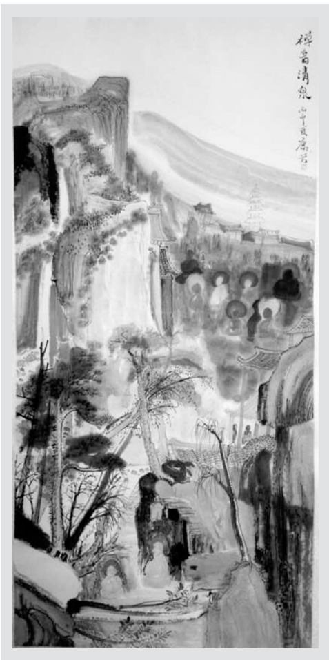
禅音清泉(国画) 康芳

李伯安为中国画的创新与发展、为艺术创造而献身的精神值得我们学习。中国画要发展，需要有这样的艺术家。我们不应该忘记他，他的艺术精神将永远具有强大的震撼力和榜样力量。