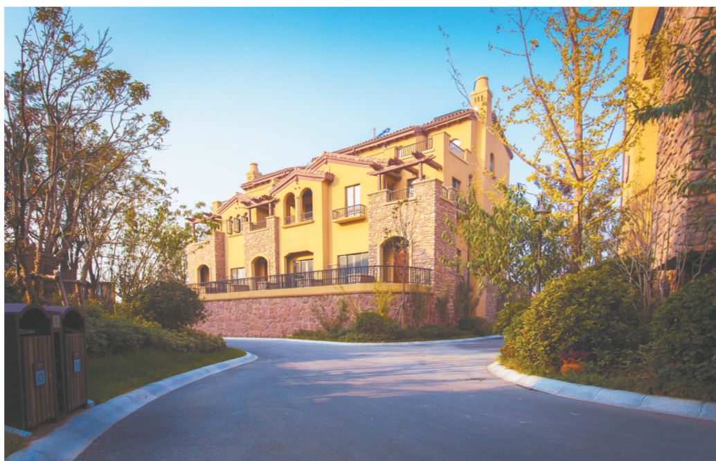
正商红河谷实景图

正商对于高端住宅鲜有建树,这次觉得正商实力不凡,能感觉到正商在品质提升上做得非凡努力。此次品质行让我对正商有了全新的认识。”