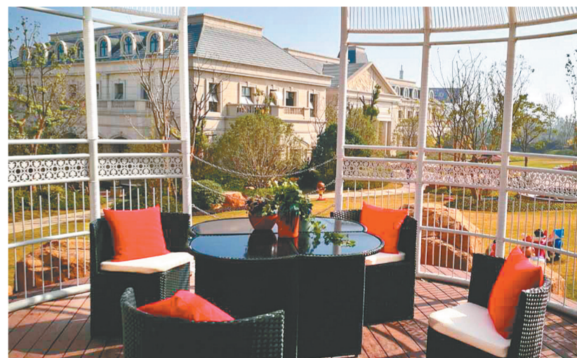
正商智慧城实景图

“这次品质行,正商真正打动我的不是小区的外立面多高端,绿化得多好,物业有多么贴心。而是这里的公租房建造得跟商品房一样,也没有把两个区域隔开,将来公租房的住户一样