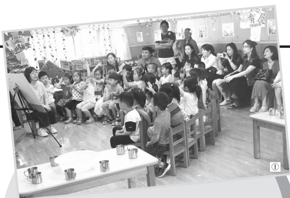
① 昨日上午,管城回族区商城幼儿园举行“家长开放日”活动。邀请家长走进幼儿园参与体育游戏、科学探索、语言故事等丰富多彩的教学活动,受到家长的一致好评,达到了家园共育的良好效果。

本报讯(记者 张震 通讯员 张菊红)“卖菜了,纯天然、绿色无公害蔬菜,一元一捆了!”金水区文化路二小“绿色种植社团”的师生近日举行了蔬菜义卖活动。眨眼工夫,队员们用两个小时整理出来的蔬菜就被抢购一空,连学校的老师也加入了购买蔬菜的行列。“绿色种植社团”的学生不仅参与种植的整个过程,激发了学生的好奇心和求知欲以及劳动的热情,通过亲身劳动,体会到劳动人民的艰辛,从而达到珍惜和分享劳动成果的教育目的。这不仅培养了学生的劳动观念,还使学生树立了正确的劳动观念,养成了良好的劳动习惯,并培养了学生良好的道德品质。