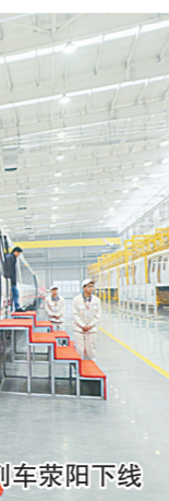
首列“郑州造”地铁列车车下线

我市先后出台《中国制造2025 郑州行动纲要》、郑州市建设中国制造强市三年行动计划、郑州市建设中国制造强市若干政策、郑州市汽车及装备制造产业提升发展专项规划、郑州市“十三五”智能制造装备产业发展规划等一系列规划和政策,通过总体部署发展方向、详细制定产业政策等,不断引导产业向高端延伸,支持装备制造加快转型升级,推进行业向智能化、精密化、高端化、绿色化方向发展。