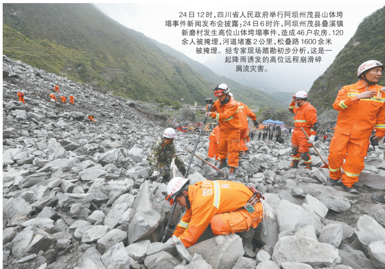
24日12时,四川省人民政府举行阿坝州茂县山体垮塌事件新闻发布会披露:24日6时许,阿坝州茂县叠溪镇新磨村发生高位山体垮塌事件,造成46户农房、120余人被掩埋,河道堵塞2公里,松叠路1600余米被掩埋。经专家现场踏勘初步分析,这是一起降雨诱发的高位远程崩滑碎屑流灾害。