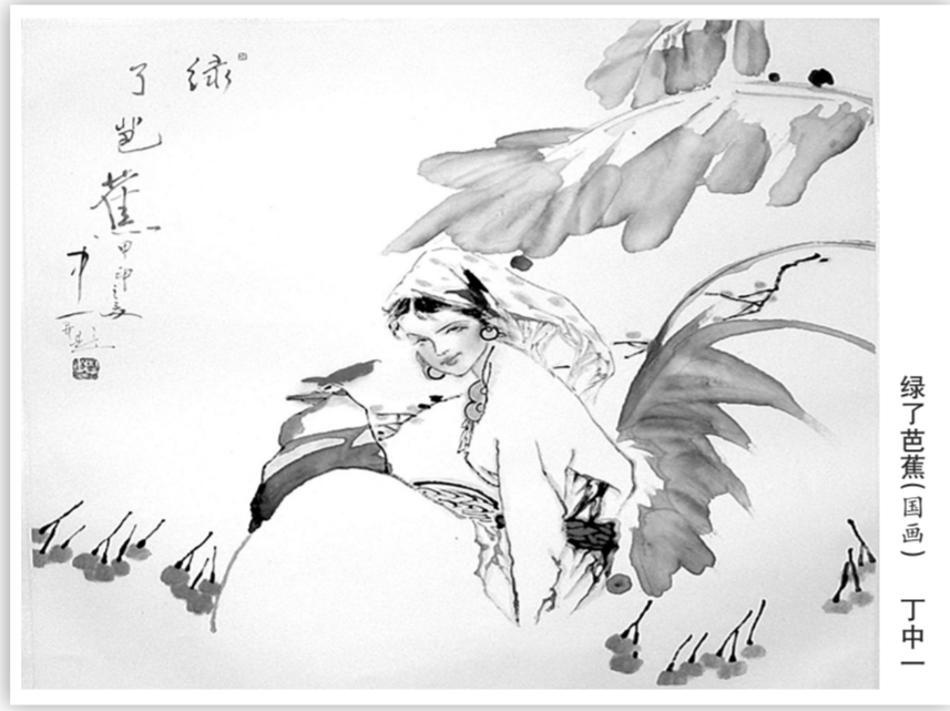
绿了芭蕉(国画) 丁中一