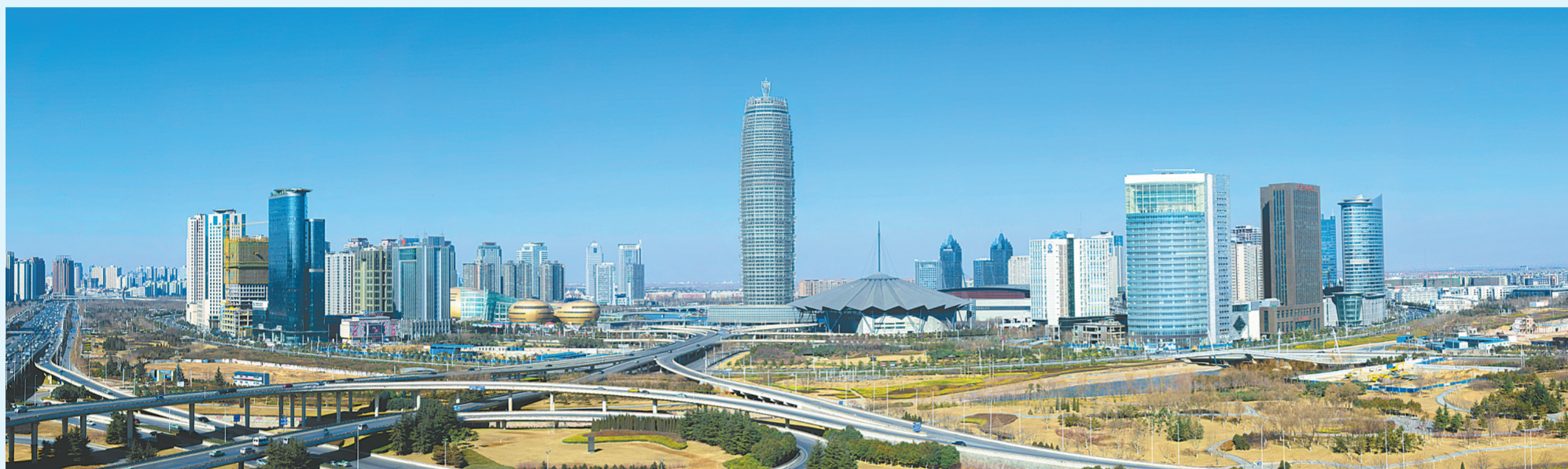
作为中原城市群核心城市,郑州的魅力不断释放。

这也意味着以郑州为核心城市的中原城市群,与长三角、珠三角等城市群一样,开始区域抱团发展参与世界城市竞争。