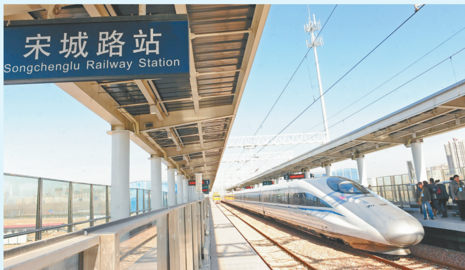
交通枢纽地位推动郑州加速融入世界

原城市群”包含5个省30个城市,28.7万平方公里,面积之大,辐射区域之广,引发国内外媒体对这一国家级城市群的强烈关注。