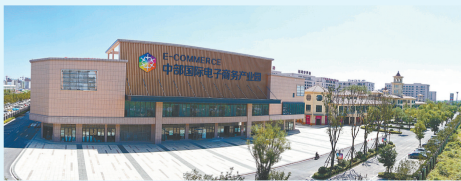
中部国际电子商务产业园,力争打造电子商务全产业链综合服务园区。

从郑州的政治历史地位来看,郑州作为国家历史文化名城,是华夏文明的重要发祥地之一,是五帝活动的腹地、中华文明轴心区。早在三千多年前,成为中国商代中期都城。郑州已经成为中国历史文化的一