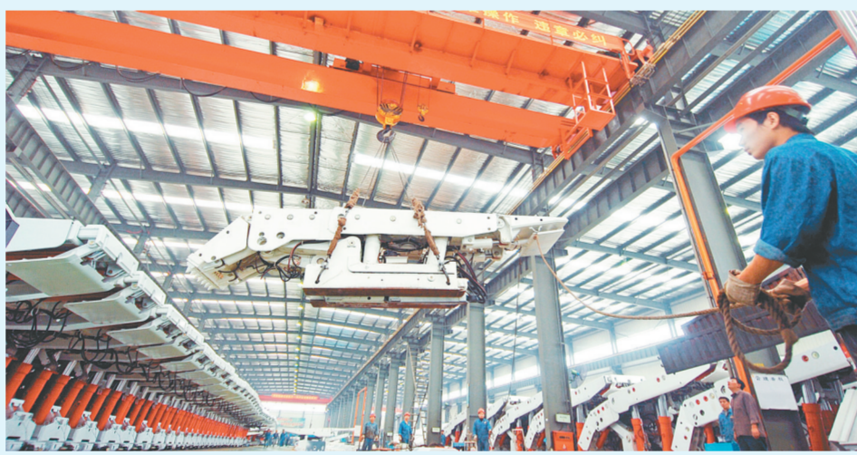
生产车间管理高效

2016年，全市软件和信息服务业实现主营业务收入360亿元，同比增长20%，其中软件业务收入260亿元。全市现有规模以上软件和信息技术服务业企业207家，累计登记软件产品2700余个。产业规模和企业数量均占河南全省80%以上，年均增长速度在20%以上，成为“郑州制造”中“常青”的高成长性产业。