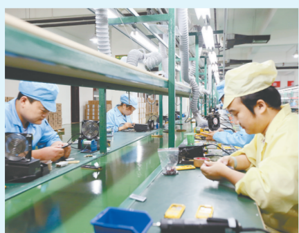
信息产业发展迅猛

新业态新模式发展迅速。依托大数据、云计算等新模式，以网络零售为代表的新经济、新业态发展迅猛，全市跨境电商电子商务交易和网络零售快速增长。