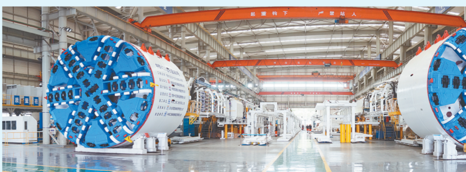
郑州制造叫响全球

《方案》明确未来将做大做强三大战略性新兴产业。其中，电子信息产业到2019年主营业务收入力争突破4000亿元，汽车产业到2019年主营业务收入力争达到1500亿元，新材料产业到2019年主营业务收入力争达到2500亿元。培育发展三大新兴产业。到2019年，生物及医药产业主营业务收入力争达到250亿元，装备制造业主营业务收入力争达到2100亿元，其中高端装备制造达到800亿元，节能环保产业则要着力形成全国重要的节能环保产业集群。