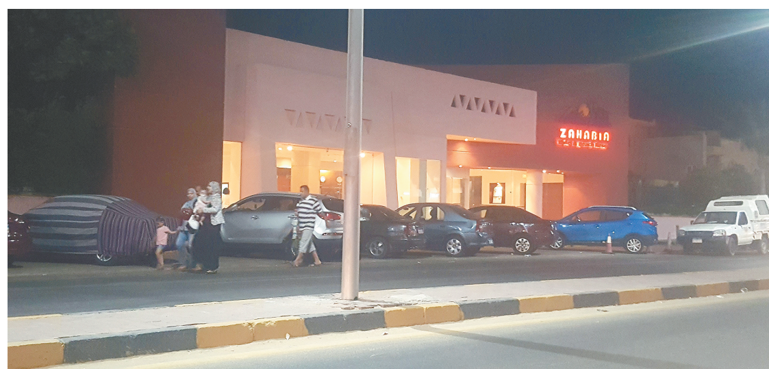
这是7月14日在埃及红海海滨城市胡尔加达拍摄的发生袭击事件的度假村。 新华社发

上周,23名埃及安全部队士兵在西奈半岛一处偏远检查站被武装分子杀害。这是近两年来埃及及军方人员损失最惨重的一次袭击。极端组织“伊斯兰国”埃及西奈半岛分支“西奈省”组织宣称制造了这起袭击。 新华社特稿