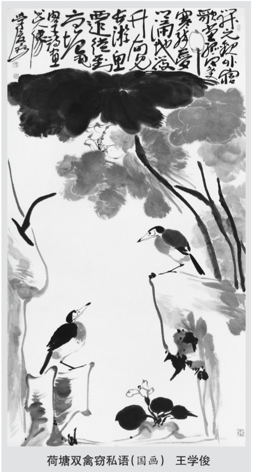
荷塘双禽窃私语(国画) 王学俊

“我代表学生谢你了啊！”牛树林真会夸张，他这样一弄，好像保护小鱼的事成了不申请就不能做的事情了。