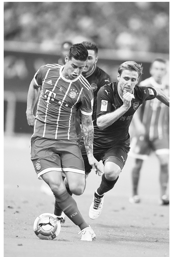
J罗(左)在与阿森纳队比赛中