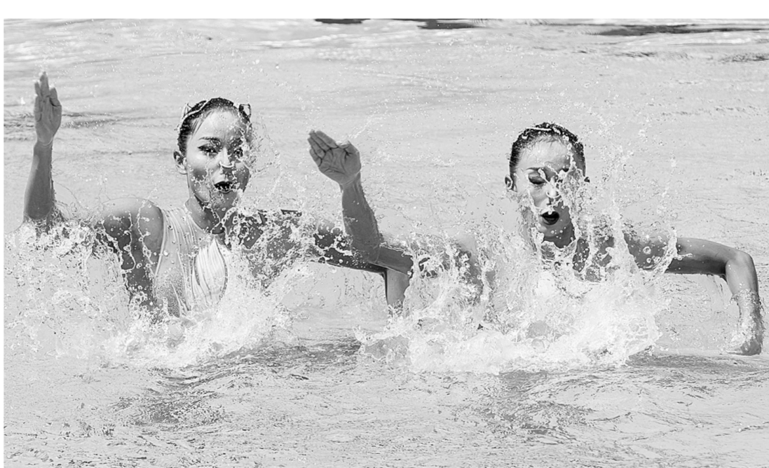
蒋文文和蒋婷婷在布达佩斯世锦赛上表演。

从现场大屏幕看到分数的那一刻,两人互相搂了搂肩。那场比赛表现时,她们用了一个相同的词:欣慰。“能高一点都是不容易的事情,打到95分以上,是我们这段时间以来分数最高的,我们感到很欣慰。”