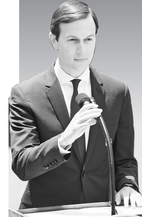
7月24日,在美国首都华盛顿白宫,美国总统特朗普的女婿、白宫高级顾问库什纳发表声明。

就“通俄门”事件缄默良久的美国白宫高级顾问、总统唐纳德·特朗普的女婿贾里德·库什纳24日终于开口了。这名自称“不好出风头”的房地产大亨说,自己“没什么好隐藏的”,特朗普的竞选团队没有通俄。 库什纳定于24日出席国会参众两院情报委员会的闭门听证会并作证。临行前,他发表一份长达11页的声明,详细讲述了特朗普竞选总统和新政府过渡期间库什纳与俄罗斯方面打过的4次交道。 美联社报道,库什纳这次国会作证备受关注,一方面因为他是特朗普家族首名因“通俄门”调查接受国会拷问的“圈内人”,另一方面由于他本人给人的印象寡言内向,很少在公开场合发声,从未澄清过自己卷入“通俄门”的传闻。 库什纳在声明中说:“我不是一个追求被关注的人……我自己本人没有与外国政府勾结,就我所知,特朗普竞选团队中没有人有这样的行为。” 他说,自己与俄罗斯方面的4次接触都是正当合法的,他自己的生意也从没得到俄罗斯方面资助。 库什纳就特朗普长子前不久被曝出的“律师门”作出澄清。 库什纳给出的说法是,小特朗普邀请他出席当天的会议,他当时还迟到了,一进会场后听到女律师谈到美国家庭收养俄罗斯儿童的事宜,他觉得是“浪费时间”,发短信叫助理打电话给他,好找借口提前离场。 库什纳在声明中严谨地说:“我出席的这场会谈没有任何部分谈及美国选举。” 对于《华盛顿邮报》此前报道,库什纳去年12月曾在位于纽约的特朗普大厦会见俄罗斯驻美国大使谢尔盖·基斯利亚克。库什纳当时对基斯利亚克提议,开通一条能与克里姆林宫直接沟通的秘密渠道。 库什纳说,自己从未要求开通与俄罗斯联系的所谓“秘密渠道”。他补充说,他与俄罗斯方面的另一次会面是应基斯利亚克的要求,对方是一名俄罗斯银行家,两人并未谈及任何具体政策。 新华社特稿