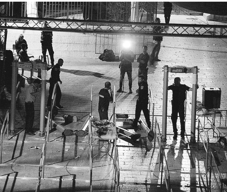
7月25日,在耶路撒冷老城圣殿山(穆斯林称为“尊贵禁地”)入口处,工作人员拆除金属探测门。 以色列总理府发表声明说,以色列安全内阁已经决定拆除安放在耶路撒冷老城圣殿山(穆斯林称为“尊贵禁地”)入口处的金属探测门。 新华社发

以色列总理本雅明·内塔尼亚胡25日凌晨突然宣布,以方决定拆除安放在耶路撒冷圣殿山(穆斯林称“尊贵禁地”)、引发冲突的金属安检门。以色列总理府发表声明说,以色列安全内阁当天凌晨举行一天之内第二场会议,表决接受“所有安全部门的建议,采用以先进技术(‘智能检查’)及其他方式为基础的安保措施,取代金属探测器”。