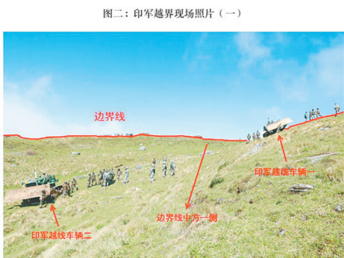
图二：印军越界现场照片(一)