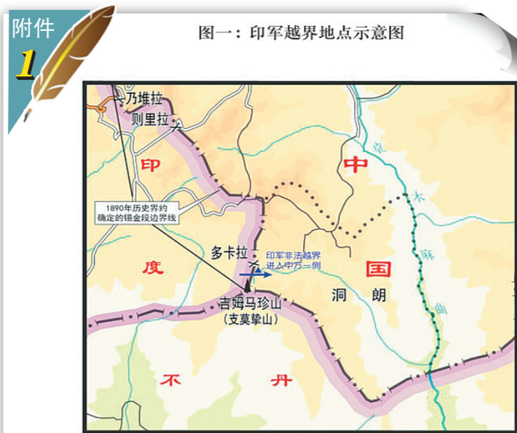
图一：印军越界地点示意图

耿爽表示，中方发布《印度边防部队在中印边界锡金段越界进入中国领土的事实和中国的立场》文件，目的是向国际社会进一步说明此次印军越界事件的事实真相，全面阐述中国政府立场。中方这么做，是为了维护本国的领土主权，也是为了维护国际法的基本原则和国际关系的基本准则，维护公平和正义。中方相信，是非自有曲直，公道自在人心。