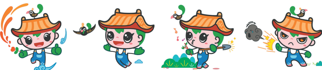
吉祥物“园宝”动作图

头顶一只吉祥玄鸟,源于《诗经》作品《玄鸟》中“天命玄鸟,降而生商(今河南郑州等地)”,寓意喜迎第十一届中国国际园林博览会落户河南郑州。以汉字“家”布局整体结构,玄鸟为点,建筑屋顶形帽为宝盖,下面家园里的儿童憨态可掬,张开双臂喜迎四方宾客,表达了人与自然和谐相处、绿色共享的美好愿景,诠释了园林与美好家园的关系,体现了本届园博会“引领绿色发展,传承华夏文明”“园林让城市更美好”的办会理念和“百姓园博”“园博让生活更美好”的特色。