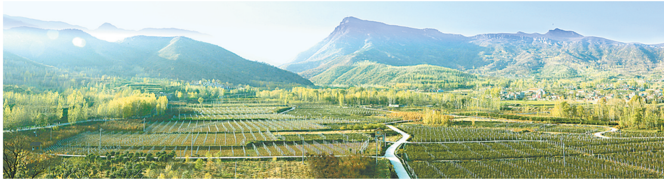
登封市雅新园艺公司流转贫困村土地2000多亩，安置贫困户劳动力就近就业100多人。