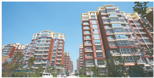
新郑具茨山新型社区一期

通过易地搬迁及一系列配套扶持措施，群众实现了搬得出、稳得住、能发展、可致富。易地扶贫搬迁已成为“挪穷窝、换穷业、拔穷根”式脱贫工程。