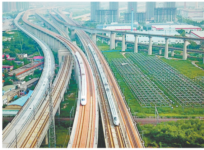
两列动车组列车驶入郑州东站