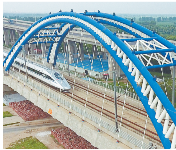
京广高铁黄河大桥