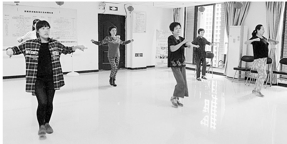
姚砦社区，老人正在学习交谊舞。

色。同乐社区是一个典型的老旧小区，小区内多为原国企下岗、离退休人员，其中有离退休老干部52名。社区把离退休老干部、老职工当成“宝”，依托社区硬件设施，以老干部、老职工“就近学习、就近活动、就近得到关心照料、就近发挥作用”为目标，组织老干部发挥余热，面向社区青少年开展革命传统教育活动，让老干部、老职工充分感受到社区的温暖。