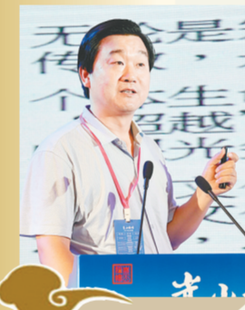
北京大学哲学系教授、宗教文化研究院副院长李四龙

李四龙说，中印医疗文化系统融合、建构的成功例子使得自己产生这样的认识：中国文化是一个开放的文明体系，能包容来自不同地区的文明传统，从而形成一个综合的文明新境界，共建天下文明。