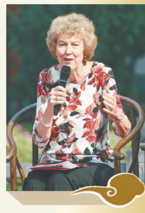
美国耶鲁大学林业与环境研究学院、神学院高级讲师、研究学者玛丽·伊夫林·塔克

她认为，儒家一直以来都强调在环境之中，保持阴阳平衡，和谐共生，从西方的宇宙论、进化论来讲，也一直强调我们从哪里来，如何看待重视自然保护这些问题，就需要东西方专家学者一起来交流学习，达成一种共识，引导全世界文明、文化和谐有序发展。具体践行，我们要通过建造全球性社区，建设绿色城市，为社会经济发展、子孙后代生存提供滋养。