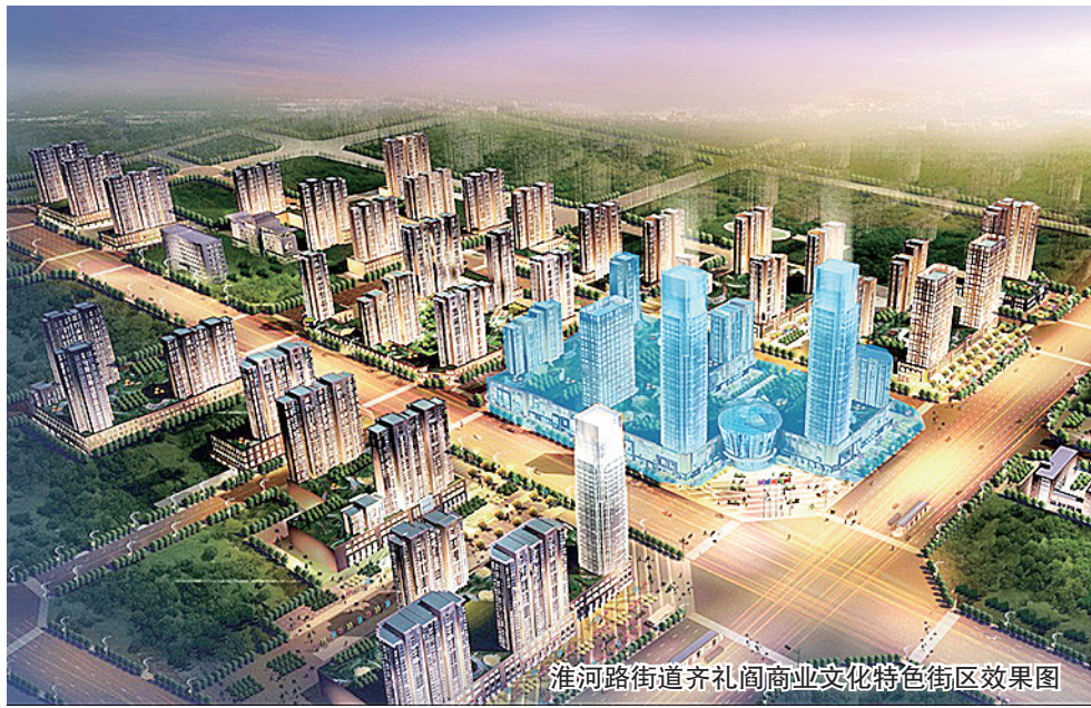
淮河路街道齐礼阎商业文化特色街区效果图

2012年路岩回迁安置后,为了逐渐扭转村民的老旧观念,村“两委”自发成立了物业公司,80%的工作人员都是村民,聘请专业的物业培训师进行全方位的培训,逐渐让公司从“盲人摸象”到步入正轨,小区还设置综合文化活动功能室,居民的文化活动丰富多彩。路岩社区的回迁改造,从“村民”到“市民”,不仅是环境的变化,更是完成了心态和生活方式的转变,堪称城中村改造的标杆之作。