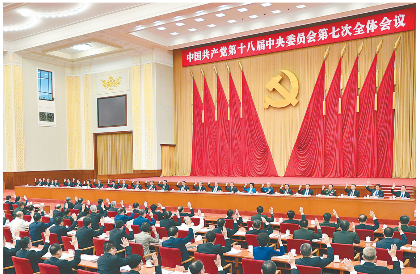
中国共产党第十八届中央委员会第七次全体会议,于10月11日至14日在北京举行。中央政治局主持会议。