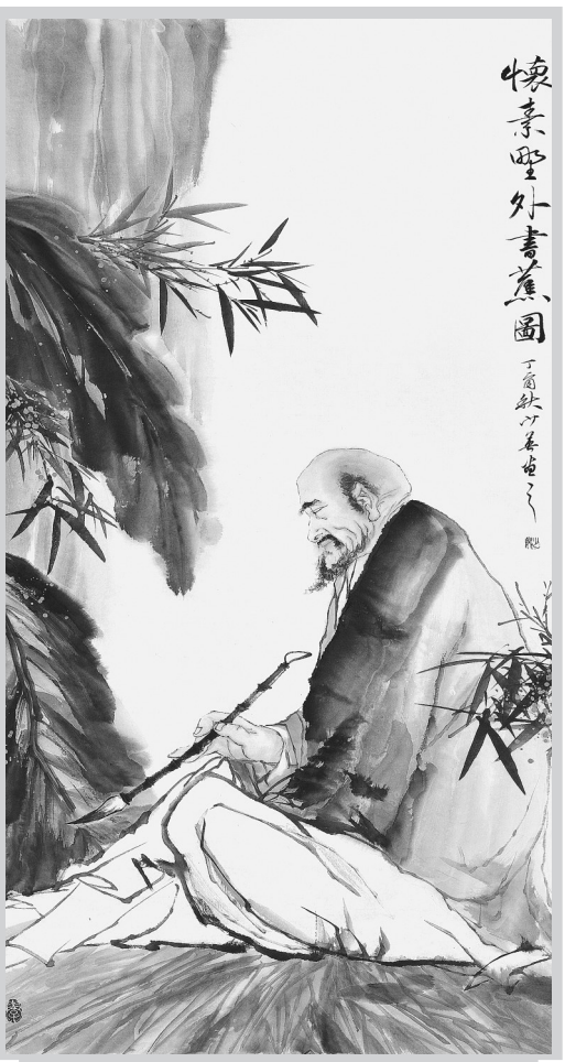
怀素野外书蕉图(国画) 宋少英