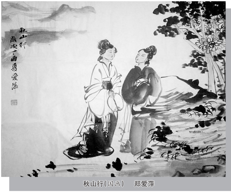
秋山行(国画) 郑爱萍