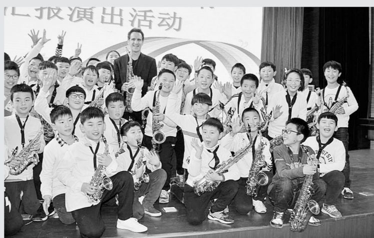
11月17日,曾赢得了两项格莱美大奖的国际著名演奏家Eric Marienthal走进惠济区实验小学萨克斯风乐团,用激情澎湃的演奏赢得观众热烈掌声,他还给孩子们进行现场指导,令孩子们受益匪浅。据介绍,该校“金色旋律”萨克斯风乐团成立于2016年11月,由学校84名萨克斯爱好者组成,旨在倾力打造精湛的少儿萨克斯打击乐团。