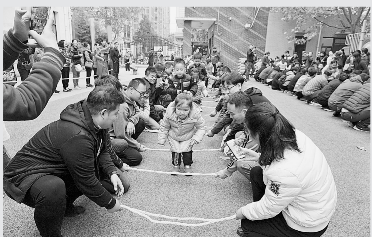
11月17日,随着暖场音乐《小宝贝》的响起,管城回族区商城幼儿园亲子运动会拉开序幕。在《小青蛙》《小飞机》《彩虹伞》《两人三足》等亲子游戏中,爸爸和孩子们配合默契、奋勇争先,妈妈们激动地加油喝彩,运动会的场面热火朝天。此次亲子运动会内容丰富,形式多样,促进幼儿走、跑、跳、钻、爬、平衡等多种能力的发展,深受幼儿及家长的喜爱。