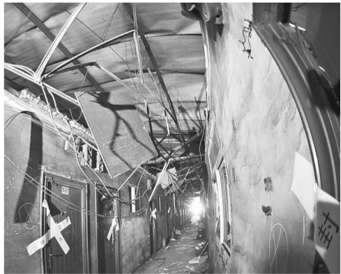
聚福缘公寓二层过道

最多的时候也租了30多人，火灾彻底让我警醒了我。我让他们都退租了，实在太危险了。”