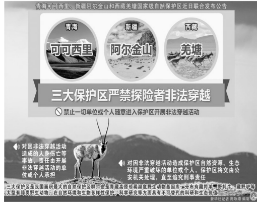
对非法穿越保护区、非法进入保护区开展非法穿越活动

《通知》确定了原则上无需静脉输液治疗的常见病多发病，要求各医疗机构建立静脉输液管理长效机制，普及合理使用静脉输液知识。基层医疗机构(含社区卫生服务中心、乡镇卫生院、村卫生室)、诊所、门诊部、一级医院(含专科)符合医疗机构标准等要求的，方能开展门诊静脉输液服务。