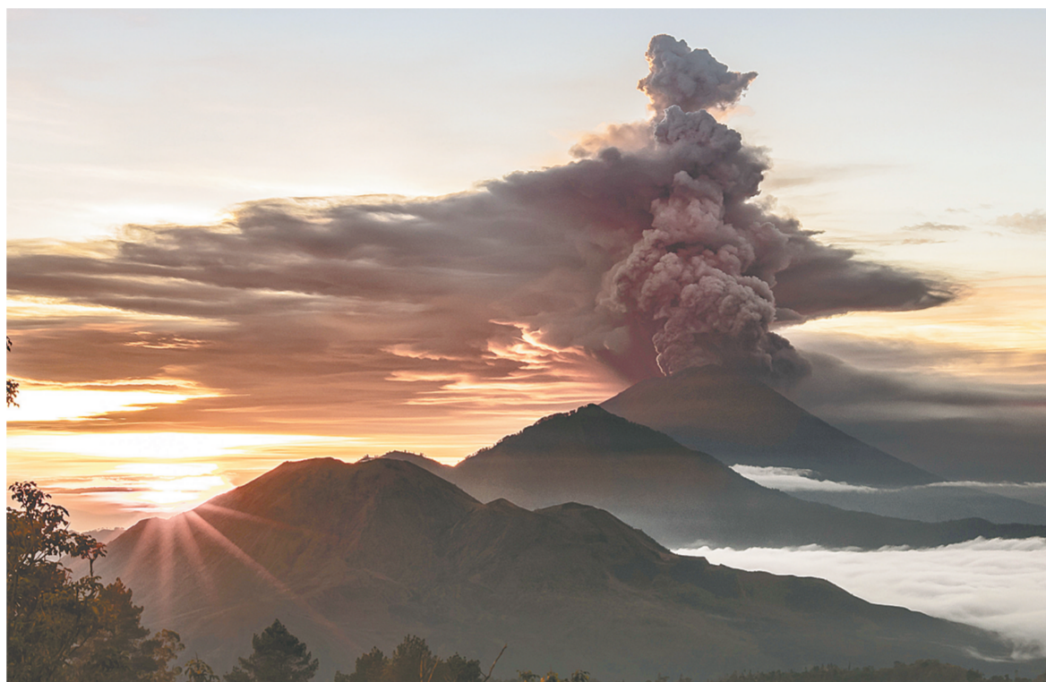
26日，在印度尼西亚巴厘岛，阿贡火山喷出火山灰。

新华社雅加达11月26日电(郑世波)印度尼西亚巴厘岛上的阿贡火山25日下午再次喷发。中国驻登巴萨总领馆26日在官网上发布公告，紧急提醒中国公民近期谨慎前往巴厘岛旅游。 印尼火山和地质灾害减灾中心报告说，25日下午5时30分，阿贡火山再次喷发出大量火山灰，灰柱高达1500米。此后阿贡火山不断喷出火山灰和烟雾，火山灰柱最高达到4000米并伴有红光，火山可能随时喷发岩浆。火山灰随风飘向东南和东南方，并往龙目岛扩散。