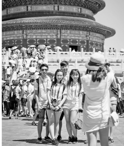
2015年7月2日，参观天坛的“龙脉相传 青春中华——全国台联2015年台胞青年千人夏令营”营员在祈年殿前合影。

两岸同胞是命运与共的骨肉兄弟，是血浓于水的一家人。30年来，两岸人员往来累计突破1.2亿人次，两岸贸易额增长超过120倍，上百万同胞在大陆学习生活，两岸组建婚姻家庭近38万对……同胞携手构建两岸命运共同体已成为两岸关系发展的主旋律，无论两岸关系如何风云变幻，都无法阻挡两岸交流的沛然之势，无