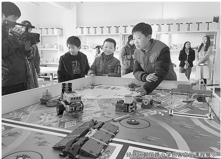
经开区朝凤路小学创客空间课程展示

“我们把原来两个30分钟的大课间活动,改为每天下午最后一节一个小时的运动课。同时,为每个班级确定了足球操、篮球操、健美操、踏板操、花样轮滑、啦啦操、呼啦圈、棍操等项目,实现‘一生一项目、一班一特色’。”