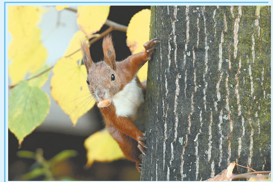
公园内,小松鼠叨着一颗坚果。