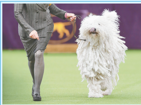
动物展上,一只可蒙犬一展风采。

2017年,在摄影师的镜头下,这些“萌萌哒”动物们留下了一个个憨态可掬、妙趣横生的瞬间。