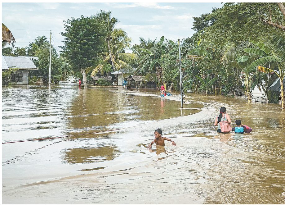
23日,在菲律宾棉兰老岛北哥打巴托省,当地居民涉水而行。

新华社马尼拉12月23日电(记者 杨柯 袁梦晨)据菲律宾警方23日夜间公布的消息,热带风暴“天秤”在非南部的棉兰老岛已造成至少200人死亡,另有70余人失踪。