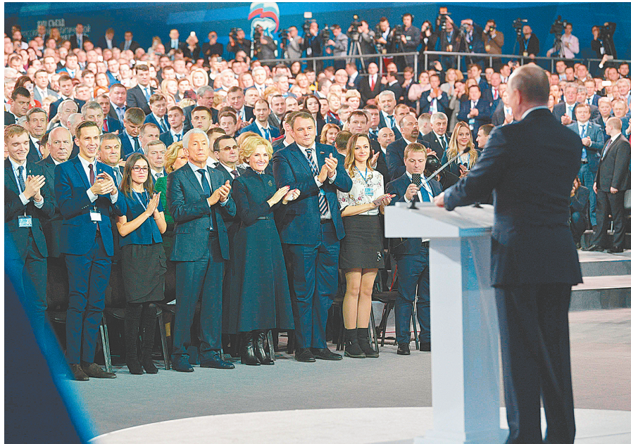
23日,普京在统一俄罗斯党第17次代表大会上发言。

普京强调,俄罗斯的经济克服了“看似不可能克服”的困难,未来的经济增长将赶超世界平均水平。为此,应从根本上更新基础设施、推动民族企业进入国际市场。