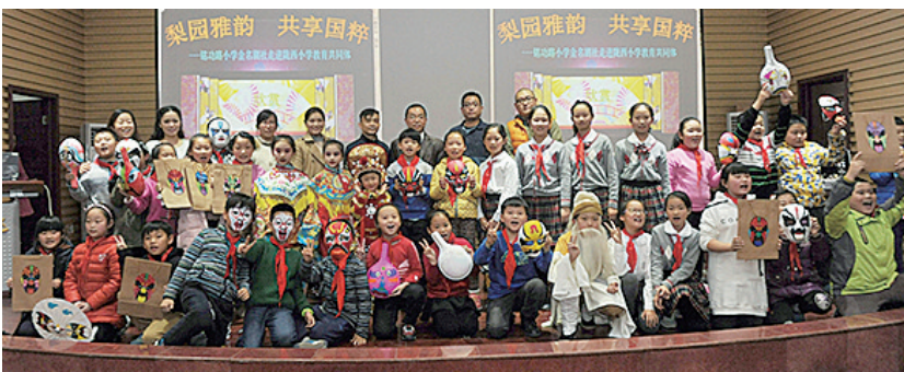
金名剧社走进陇西教育发展共同体

人员作为剧社的顾问、导师,为“小戏迷”指导教学,手把手教孩子们如何唱腔和身段塑造人物形象,不断提高孩子们唱、念、做、打的艺术功底和大胆自信的舞台表现力。此外,还指定剧社辅导员,负责校外戏曲活动的策划、组织。剧社成立以来,定期开展校内展示,受邀参加各种演出,为热爱戏曲的孩子搭建了形式多样的交流平台,取得了骄人的成绩。