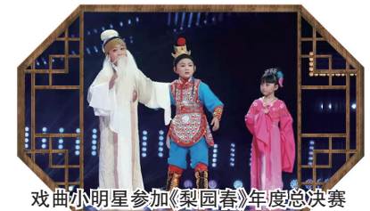
戏曲小明星参加《梨园春》年度总决赛

艺无止境。如今,铭功路小学的特色发展正意气昂扬、一路向前,在二七区多彩教育理念引领下,也将有更多的孩子从中受益,绘出精彩童年,成就更好的自己。