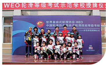
▲政通路小学荣获全国第三届“WEO”轮滑等级考试示范学校称号。