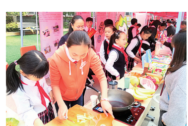
▲学校丰富的实践课程亮相全国综合实践活动年会,学校荣获全国综合实践活动课程实验先进单位称号。

此外,政通路小学还针对学生在校的某个阶段、依据学生的心理特点,选择合适的教育方法和手段,在最有效的时机实施课程,让每个关键点都成为学生成长的阶梯。例如每年的毕业季,学校都会举行毕业典礼,为他们上最后一堂必修课。