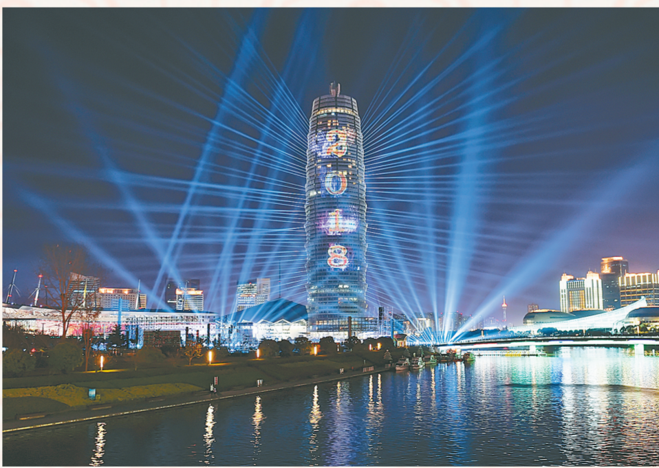
零点灯光秀在如意湖上演