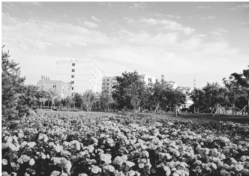
建设生态中原

1月15日,中原区委十一届三次全会提出了建设生态中原、文化中原、活力中原、幸福中原的“四个中原”建设,把环境打造、民生改善等作为区委、区政府的中心工作。与中原区工作部署不谋而合的是,中原区政协委员也把关注的焦点投向社会事业和城市管理。