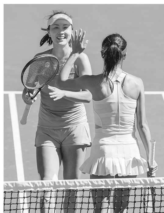
1月23日,彭帅(左)和谢淑薇庆祝胜利。当日,在2018年澳大利亚网球公开赛女子双打四分之一决赛中,彭帅(中国)/谢淑薇(中国台北)组合以2:0战胜捷克组合沙法娃/斯特里科娃,晋级四强。