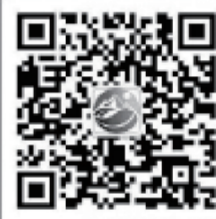
城际公交购票通道